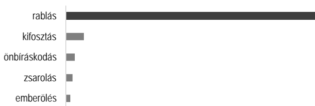
3. számú ábra: Vagyon elleni bűncselekmények megoszlása

Az elkövetők elmeállapotát tekintve elmondható, hogy 94,6 százalékuk teljesen beszámítható volt. 4 főnek enyhe fokban, 2 főnek közepes fokban és szintén 2 főnek súlyos fokban volt korlátozott a beszámítási képessége és két elkövető nem volt beszámítható.